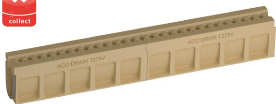
ACO DRAIN® Monoblock Bordschlitzzrinne T 275 V