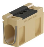
Einlaufkasten T 275 V