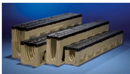
ACO DRAIN® PowerDrain