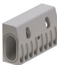
ACO DRAIN® KerbDrain