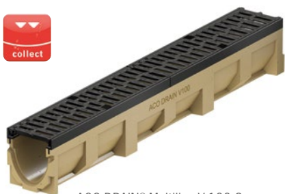
ACO DRAIN® Multiline V 100 G