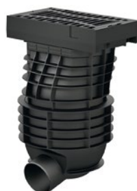
ACO Straßenablauf Combipoint PP