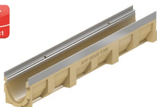
ACO DRAIN® Multiline V 100 S